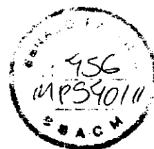
MARCOS MONTES Deputado Federal – DEM-MG