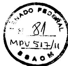
Dep. Pauderney Avelino DEM/AM