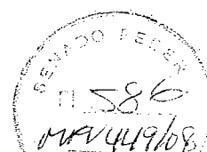
Sérgio Petecão Deputado Federal PMN/AC

Sala das Sessões, em 10 de dezembro de 2008