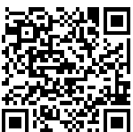
Deputado Nikolas Ferreira PL/MG

Diante do exposto, contamos com o apoio dos nobres Pares para a aprovação da presente proposição.