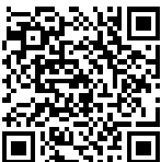
Deputada Federal LAURA CARNEIRO