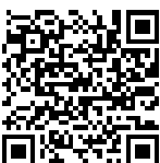
Deputada Federal LAURA CARNEIRO