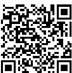
Deputada Federal LAURA CARNEIRO