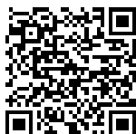
Deputada Federal LAURA CARNEIRO

Sala das Sessões, em 20 de agosto de 2025.