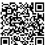
Deputado Nikolas Ferreira PL/MG