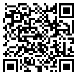
Deputada Federal LAURA CARNEIRO

Sala das Comissões, 21 de outubro de 2025.