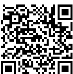
Deputada Federal LAURA CARNEIRO