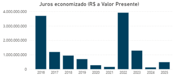
Figura 4: Juros Economizado com a aplicação das Bandeiras Tarifárias.