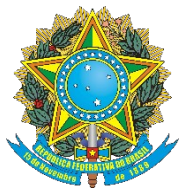
QUADRO I - SUGESTÕES DE EMENDAS AO PLN 15/2025 (PLOA 2026) – Por número