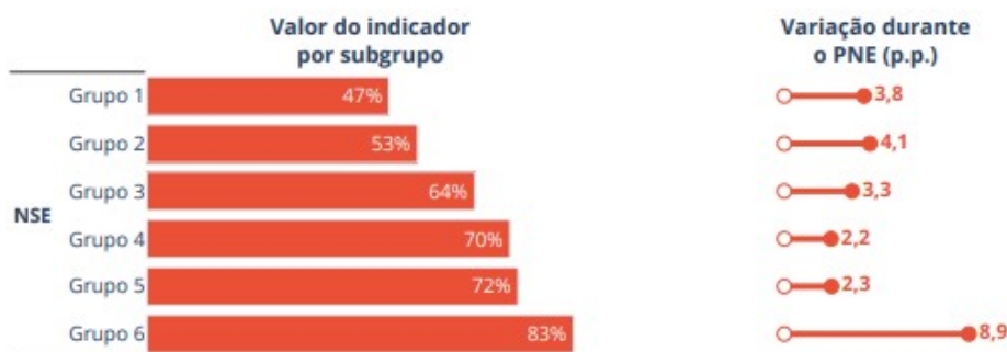
Percentual de ambientes escolares previstos no CAQ presentes nas escolas públicas

Fonte: Censo da Educação Básica / INEP / MEC. Elaboração: Campanha Nacional pelo Direito à Educação.