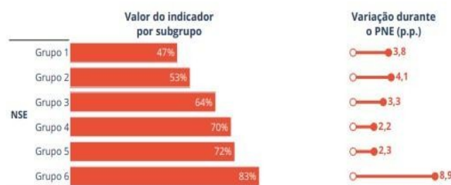
Percentual de ambientes escolares previstos no CAQ presentes nas escolas públicas