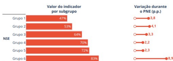
Percentual de ambientes escolares previstos no CAQ presentes nas escolas públicas