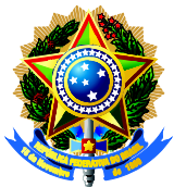
Deputada LÊDA BORGES

Apresentação: 30/04/2025 16:30:49.520 - CDU