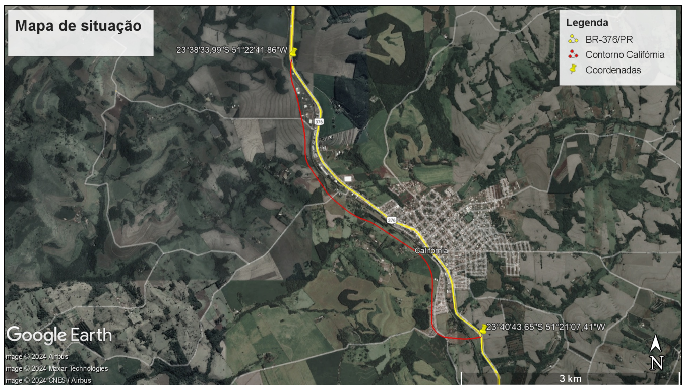
Figura 1: Contorno de Califórnia