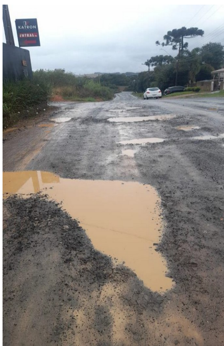
Fotos: continuação Rua José Stoebli

Diante do exposto, solicito a Vossa Excelência a destinação de recursos para a conclusão da pavimentação da Rua