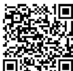
PROFESSORA LUCIENE CAVALCANTE Deputada Federal - PSOL/SP

Câmara dos Deputados | Anexo IV - Gabinete 617 | CEP 70160-900 - Brasília/DF Tel (61) 3215-5617 | dep.professoralucienecavalcante@camara.leg.br