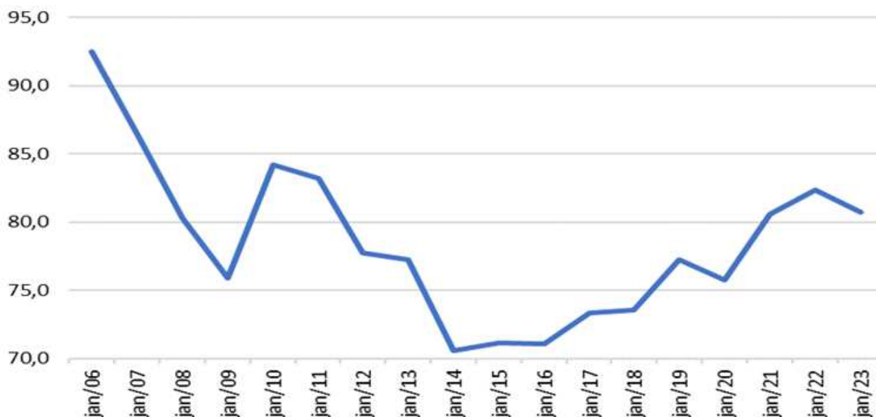
Gráfico 1. Dívida Pública Federal (DPF) como proporção da Dívida Bruta do Governo Geral (DBGG) - %

A estatística de crescimento da dívida citada no requerimento ("aumento de 9,56%") se refere especificamente à Dívida Pública Federal (DPF) em poder do público, que é uma parcela da Dívida Bruta do Governo Geral (DBGG). A relação entre a DPF e a DBGG está descrita no Gráfico 1. Além da DPF, que é uma dívida do Tesouro Nacional, a DBGG incorpora as operações compromissadas, que são uma dívida do Banco Central, e as dívidas de Governos Regionais (Estados e Municípios).