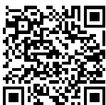
MOSES RODRIGUES Deputado Federal – União/CE

Sala das Sessões, em _____ de _____ de 2024.