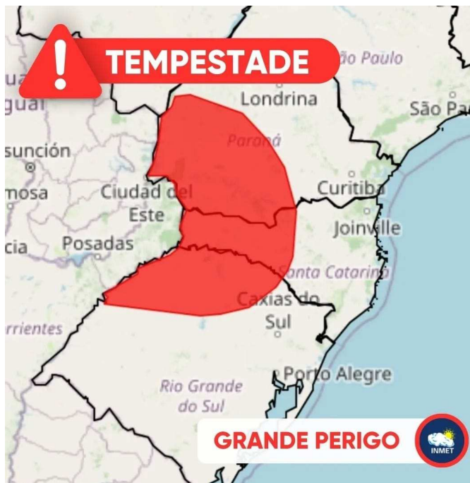
Figura 3: Área do Aviso Vermelho - Grande Perigo para tempestade com validade entre os dias 02 e 03 de novembro de 2023.

I - Aviso de tempestade (chuva e ventos fortes, acompanhadas de descargas elétricas e granizo) com validade em os dias 02 e 03 de novembro ( https://alertas2.inmet.gov.br/45346 ). A Figura 3 mostra a área prevista para o aviso de tempestade. Entre esses dias, foram observados, nas estações meteorológicas do INMET, os maiores acumulados de chuva em 1 (um) dia no Estado do Paraná neste mês (até o dia 16): 122,4 mm em Dois Vizinhos, 67,8 mm em Laranjeiras do Sul e 67,0 mm em Foz do Iguaçu.