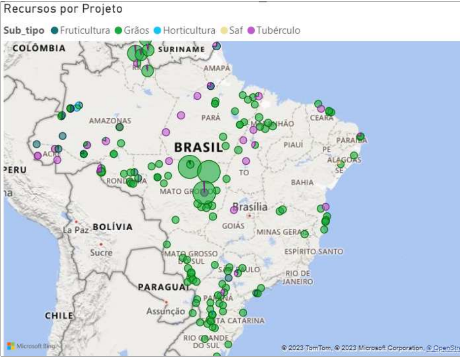
Projetos - Apoiados, Estados do MT e PA

2. Já em relação ao Item 12, saliento, primeiramente, a respeito da não existência de estudo detalhado realizado por parte desta Coordenação, abrangendo o Estado do Pará, sobre as fontes de renda dos indígenas residentes naquela região. Verifica-se, contudo, alguns estudos/diagnósticos específicos acerca de Terras Indígenas localizadas no Estado do Pará, sobre esse assunto, os dados dos projetos apoiados por esta CG durante este exercício, nos permite inferir (conforme o destacado nas figuras abaixo) que a agricultura é uma das principais fontes de renda tanto para a geração de renda como para a segurança alimentar daqueles povos, nesse sentido, também podemos destacar a criação de pequenos animais, o extrativismo vegetal e a coleta de frutos silvestres. Sobre o tema, sugere-se recorrer ao Censo Agropecuário 2017 disponível no site do IBGE, no link ao lado - CLIQUE AQUI .