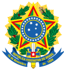
Deputado Chico Alencar PSOL/RJ

Apresentação: 31/10/2023 22:35:29.610 - Mesa