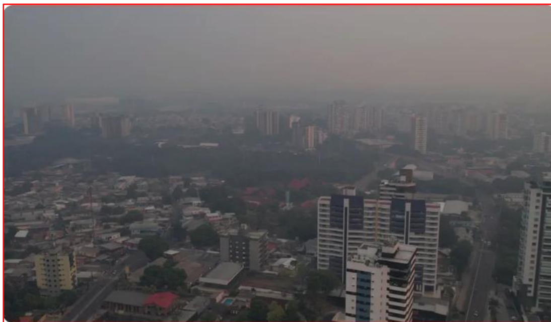
Fumaça encobre Manaus nesta quinta-feira, 28 de setembro de 2023

Mais uma vez, na manhã do dia 28 de setembro, assim como nos dias anteriores, a capital amazonense amanheceu coberta por fumaça decorrente dos incêndios. Essas queimadas têm prejudicado gravemente a biodiversidade, contribuindo para as mudanças climáticas e, o que é ainda mais alarmante, têm gerado uma fumaça tóxica que afeta a saúde de milhares de pessoas.