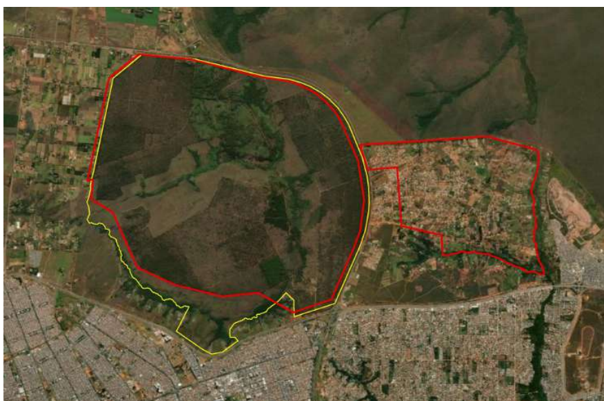
Limite da Floresta Nacional de Brasília - Áreas 1 e 2 (linha vermelha) e a proposta de ampliação (Linha Amarela)

a proposta para ampliação da Área 1, apresentada no substitutivo, corrige a impropriedade de computar as áreas até o limite da rodovia, incluindo outras ocupações que não deveriam estar dentro da proposta de ampliação da unidade, situação presente em propostas anteriores. A poligonal ajusta o deslocamento existente no limite atual, excluindo essas ocupações. Em suma, o substitutivo que se segue traz a alteração da área 1, com o memorial descritivo apresentado pelo ICMBio, totalizando uma área de aproximadamente 3.753ha (três mil setecentos e cinquenta e três hectares),.