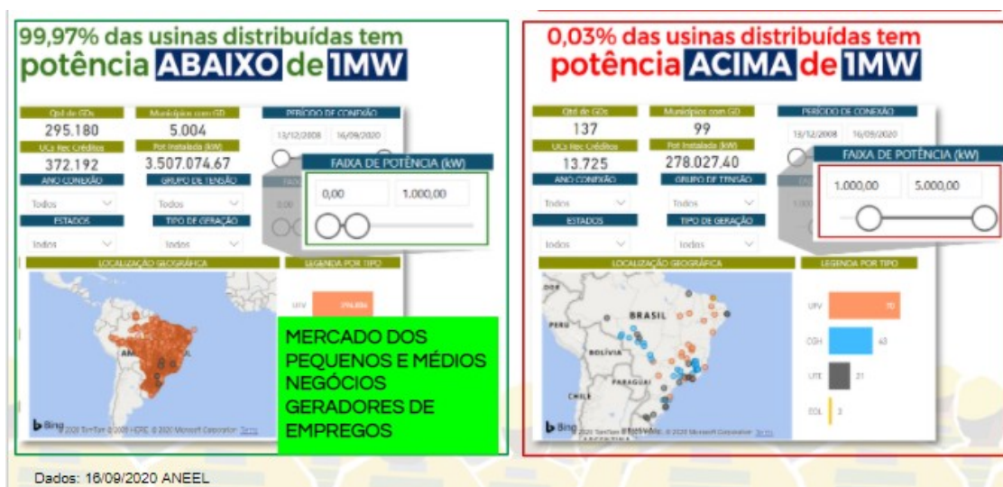
Gráfico elaborado com dados da Fonte Aneel

Segundo dados do sistema da Aneel, 99,97% das usinas solares instaladas em micro e minigeração de energia tem potência igual ou inferior a 1 MW (megawatt). Isso demonstra que o setor atende em sua esmagadora maioria os lares e pequenos e médios negócios brasileiros que são impactados fortemente pelos altos custos da energia.