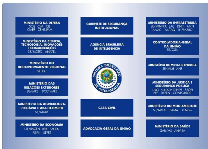
SISBIN – Sistema Brasileiro de Inteligência

Ocorre que o art. 7º do Decreto 4.736/2002, que instituiu o Consisbin, não lhe concede tal prerrogativa. In verbis :