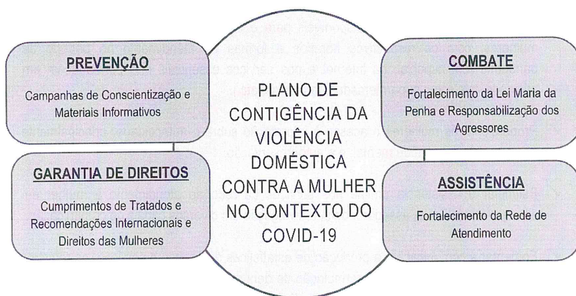
Figura 2: Eixos do Plano (Eixo I – Prevenção; Eixo II – Combate; Eixo III- Garantia de Direitos; Eixo IV – Assistência)

O enfrentamento requer a ação conjunta dos diversos setores envolvidos com a questão (saúde, segurança pública, justiça, educação, assistência social, entre outros), no sentido de propor ações que desconstruam as desigualdades e combatam a violência contra as mulheres; interfiram nos padrões comportamentais de violência contra a mulher, ainda presentes na sociedade brasileira; promovam os direitos das mulheres; e a garantia de atendimento qualificado e humanizado às mulheres em situação de violência. Portanto, a noção de enfrentamento não se restringe à questão do combate, mas compreende também as dimensões da prevenção, da assistência e da garantia de direitos das mulheres. (SNPM, 2011, p. 10)