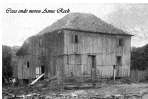
Vista da casa onde Anna Rech morou