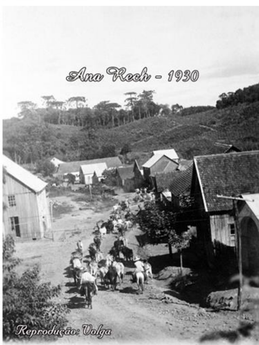
Foto de 1930 mostra tropa de gado na região