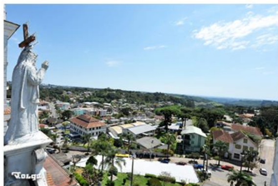
Imagem da vista atual do alto da Igreja Matriz de Ana Rech, em Caxias do Sul