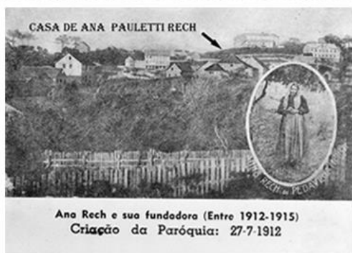
Localização da casa de Ana Rech na vila