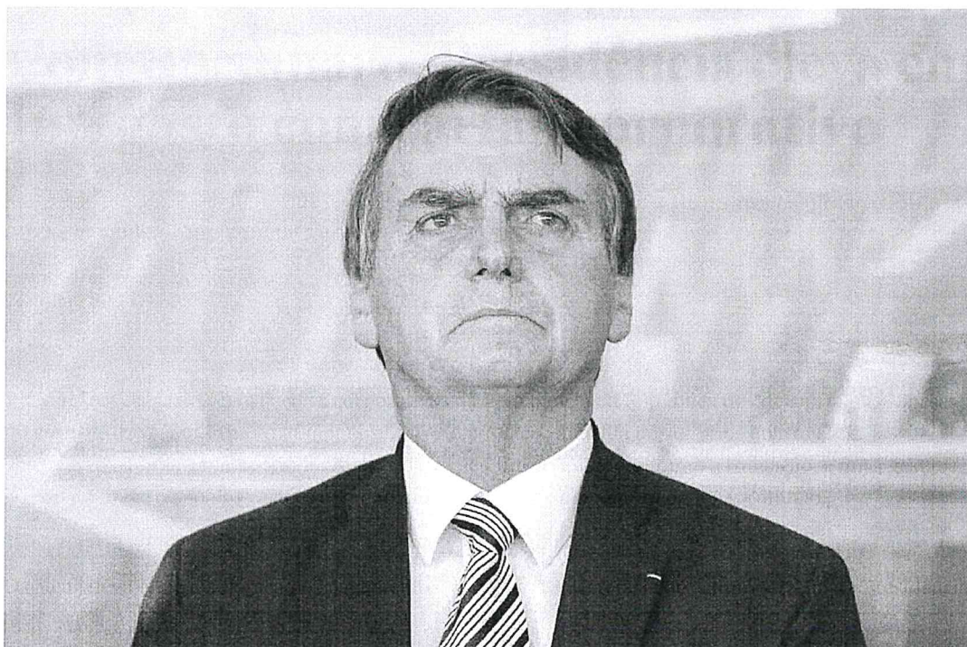
O presidente Jair Bolsonaro

O cálculo leva em consideração os pagamentos vinculados à Secretaria de Administração da Presidência da República – que incluem as despesas relacionadas ao presidente.