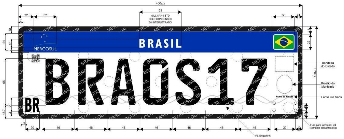
FIGURA I – PLACA DE VEÍCULOS