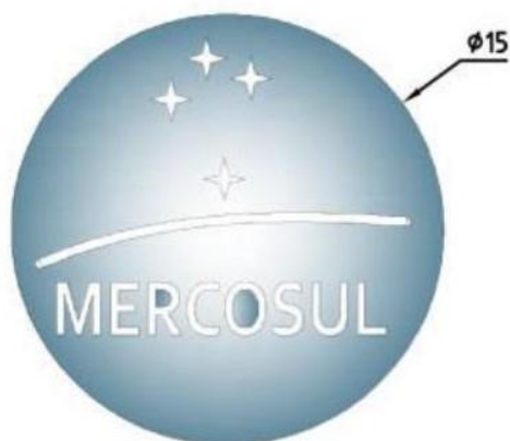
FIGURA IV – MARCAS D'AGUA DE SEGURANÇA DA PELÍCULA RETRORREFLETIVA