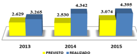
Gráfico 2 – Comparativo dos valores previstos e realizados em apoio aos tomadores de menor porte nos exercícios de 2013/2014 e 2015 (R$ mil)