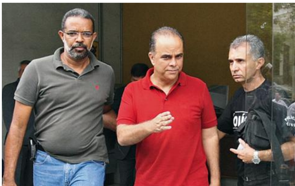
AS PRIMEIRAS REVELAÇÕES Operador do mensalão, Marcos Valério contou ao Ministério Público que o empréstimo foi necessário para proteger Lula, José Dirceu e Gilberto Carvalho

Ainda assim, quando Valério revelou a operação, Bumlai poderia ter admitido o empréstimo e alegado outro destino para o dinheiro. Mas preferiu dizer que nunca teve nada a ver com o Banco Schahin. Todos os citados por Valério adotaram a mesma estratégia. Questionado novamente, Bumlai, por meio de seu advogado, negou “qualquer envolvimento com os fatos objeto de depoimento de Marcos Valério”. E o grupo Schahin classificou o caso como “uma rematada mentira que jamais foi comprovada”.