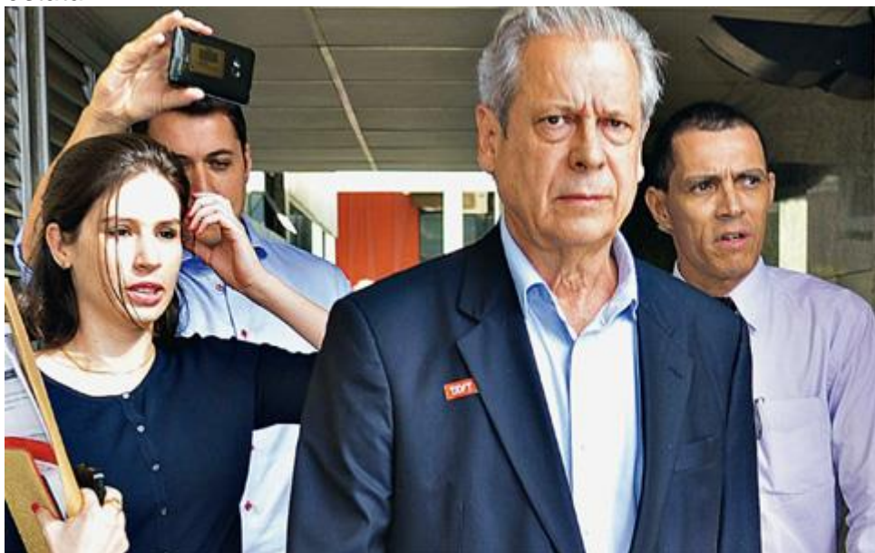
EM TODAS Mencionado por Marcos Valério, o ex-ministro José Dirceu que