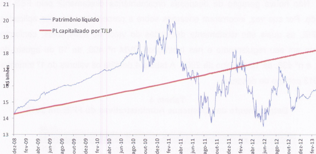
Gráfico 2 Comparativo Histórico: Patr. Líquido X Patr. Valorizado pela TJLP