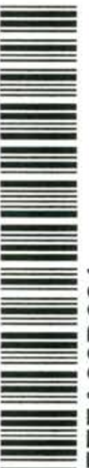
Deputado OLAVO CALHEIROS