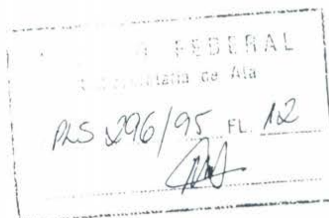
Senador ROBERTO REQUIÃO Presidente