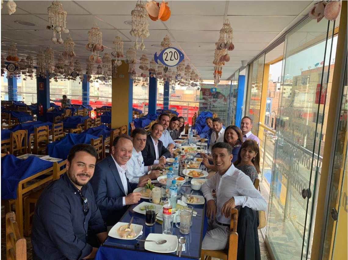
Almoço de trabalho com o Prefeito Jorge Forsay, o qual enfrenta muitos problemas, inclusive ameaça de morte, motivo pelo qual fomos cercados com muita segurança