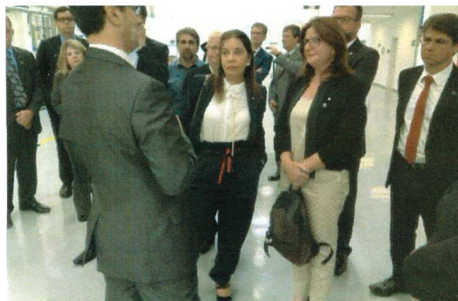
Visita guiada ao pátio de produção da Varian Systems.