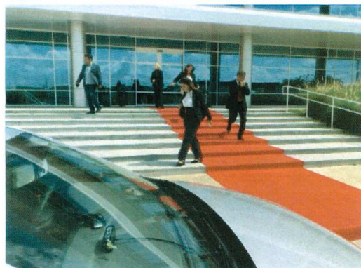
15:20 - Encerramento da visita e descolamento para o aeroporto de Viracopos.