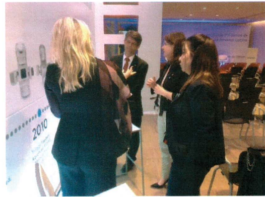
Demonstração das maquetes do equipamentos de radioterapia produzidos pela Varian Systems.