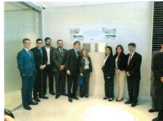
Descerramento da placa de inauguração da 1ª fábrica de aceleradores lineares da América Latina. Junto aos parlamentares, diretores da Varian Systems e autoridades governamentais.