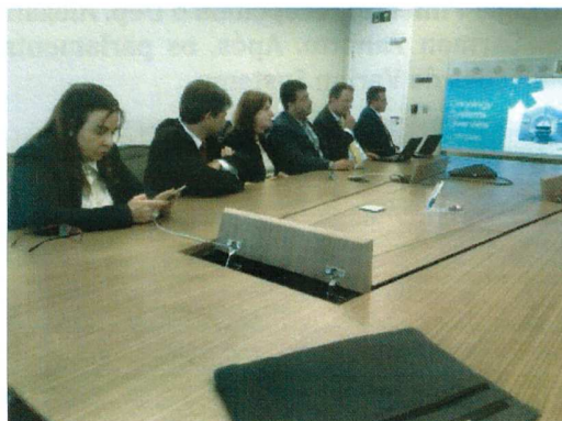
Apresentação de projetos de expansão de instalação de aceleradores lineares aos parlamentares.