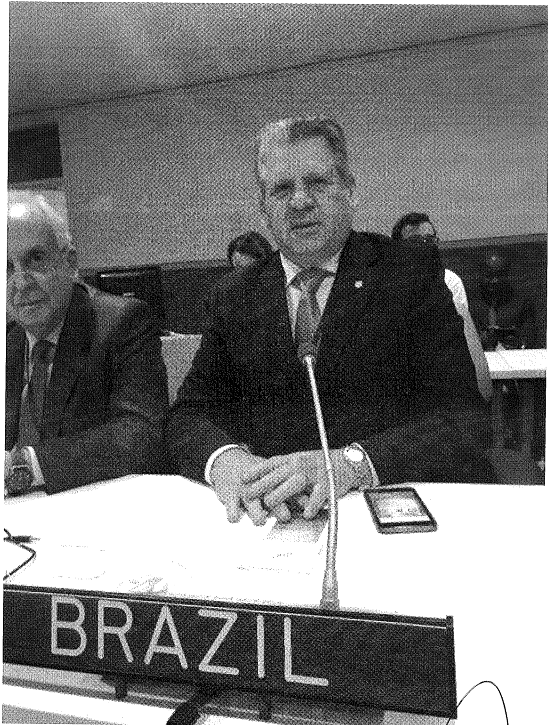
Figura 4 - Deputado Dilceu Sperafico

A large, stylized handwritten mark or signature in black ink, located in the lower right corner of the page. It consists of several loops and curves, resembling a cursive signature or a specific symbol.