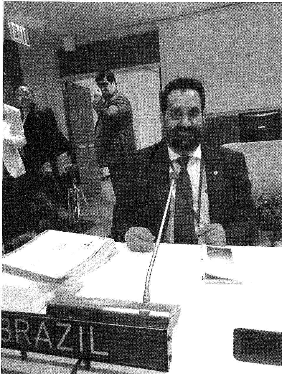
Figura 2- Deputado Cabuçu Borges