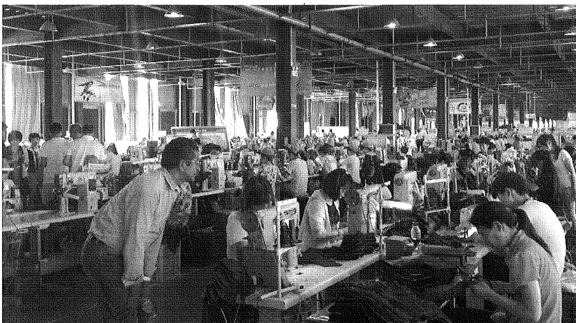
15H - Visitamos a fábrica de tênis, com 450 funcionários e compreendemos o método produtivo, além do diálogo com os empresários e os trabalhadores.