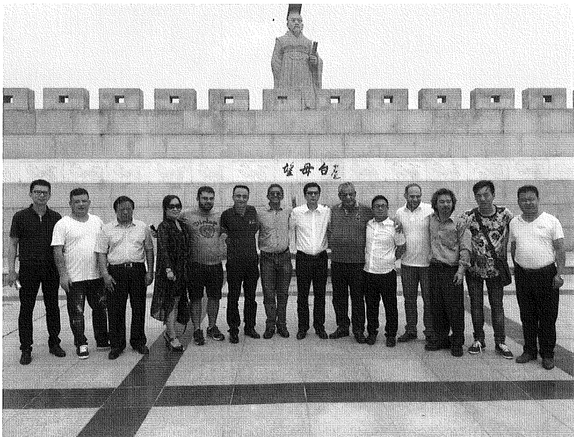
Toda a delegação de brasileiros e chineses, em visita ao Centro Histórico de ZHONG.