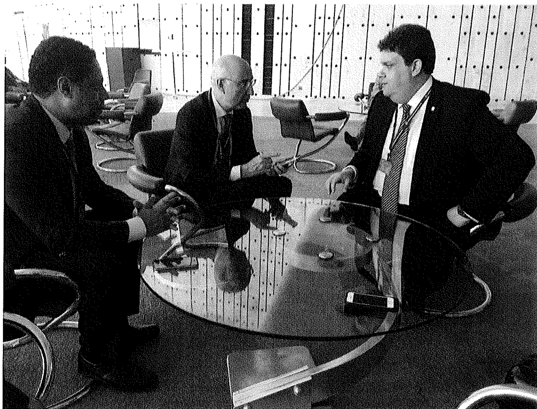
Encontro com Presidente do Tribunal Superior do Trabalho, Ives Gandra Martins, e deputado Orlando Silva, vice presidente da CTASP;

Junto com o vice-presidente da Ctasp, deputado Orlando Silva, conversamos demoradamente sobre os temas prioritários envolvendo a Ctasp e o TST.