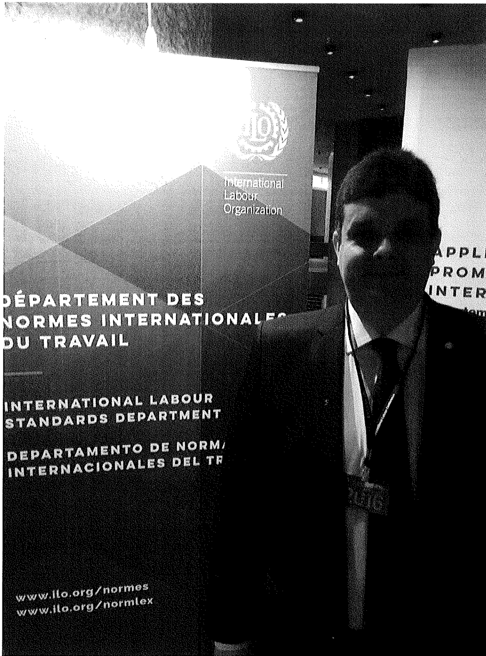
Entrada da Comissão de Normas Internacionais de trabalho;