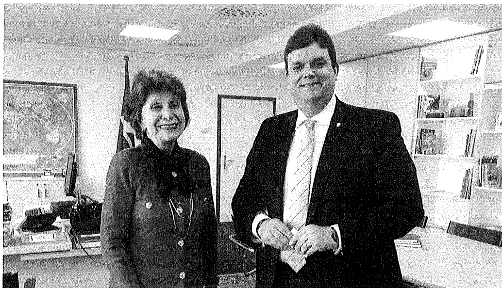
Visita à Embaixadora;

Após a solenidade de encerramento e do término do evento, fizemos uma visita à Delegação Permanente do Brasil Junto à Organização das Nações Unidas e Demais organismos Internacionais em Genebra.