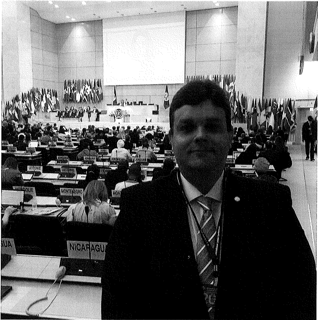
Reunião no salão principal da OIT;