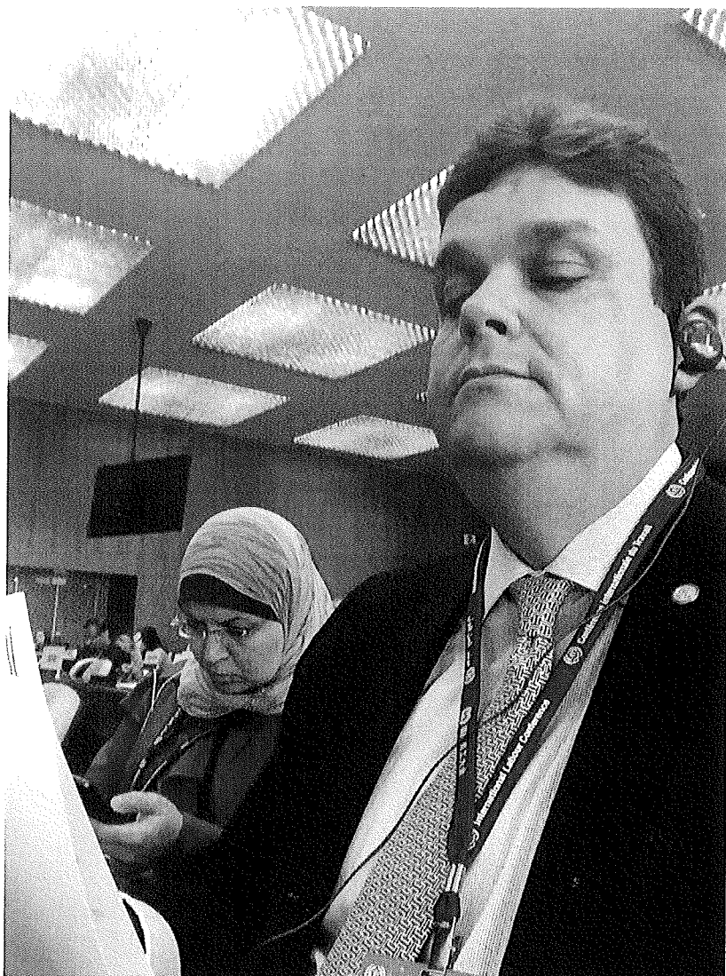
Reunião da Comissão de Aplicação de Normas;

Na Comissão de Aplicação de Normas passamos a maior parte do tempo e frequentamos as principais reuniões. Lá são levantados e debatidos temas referentes a aplicação das normas internacionais do trabalho e também é examinado como anda o cumprimento dessas normas por parte dos países membros da OIT.