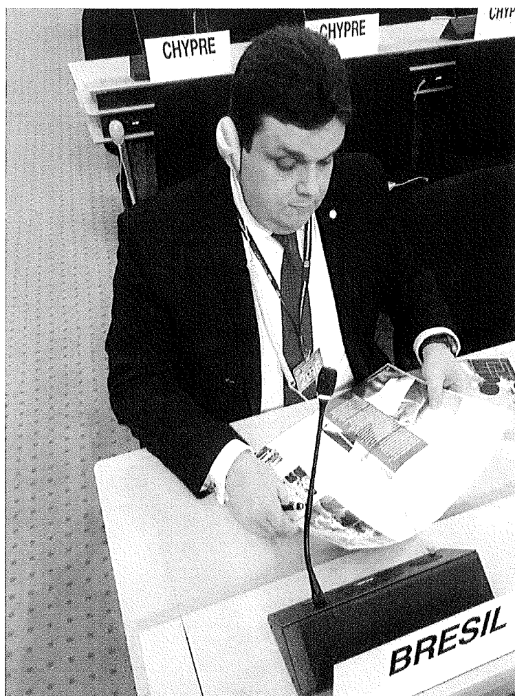
Durante uma das reuniões no plenário da Bancada do Brasil;

No salão principal da OIT, ocupamos a bancada destinada à delegação brasileira, acompanhando a discussão dos principais temas abordados nas reuniões.