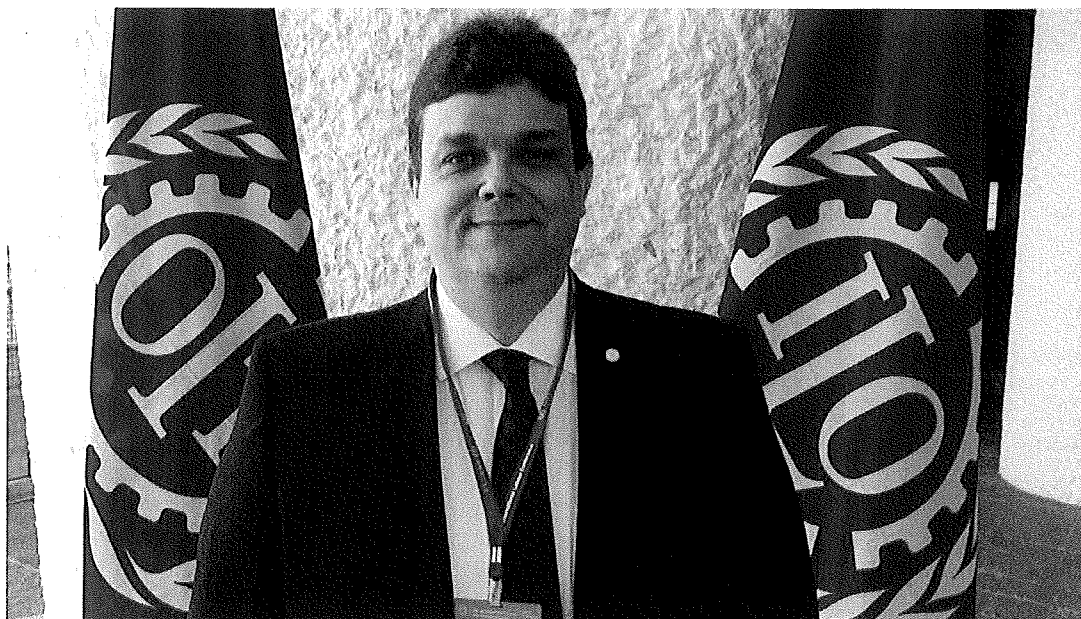
Junto a bandeira da OIT e da ILO;