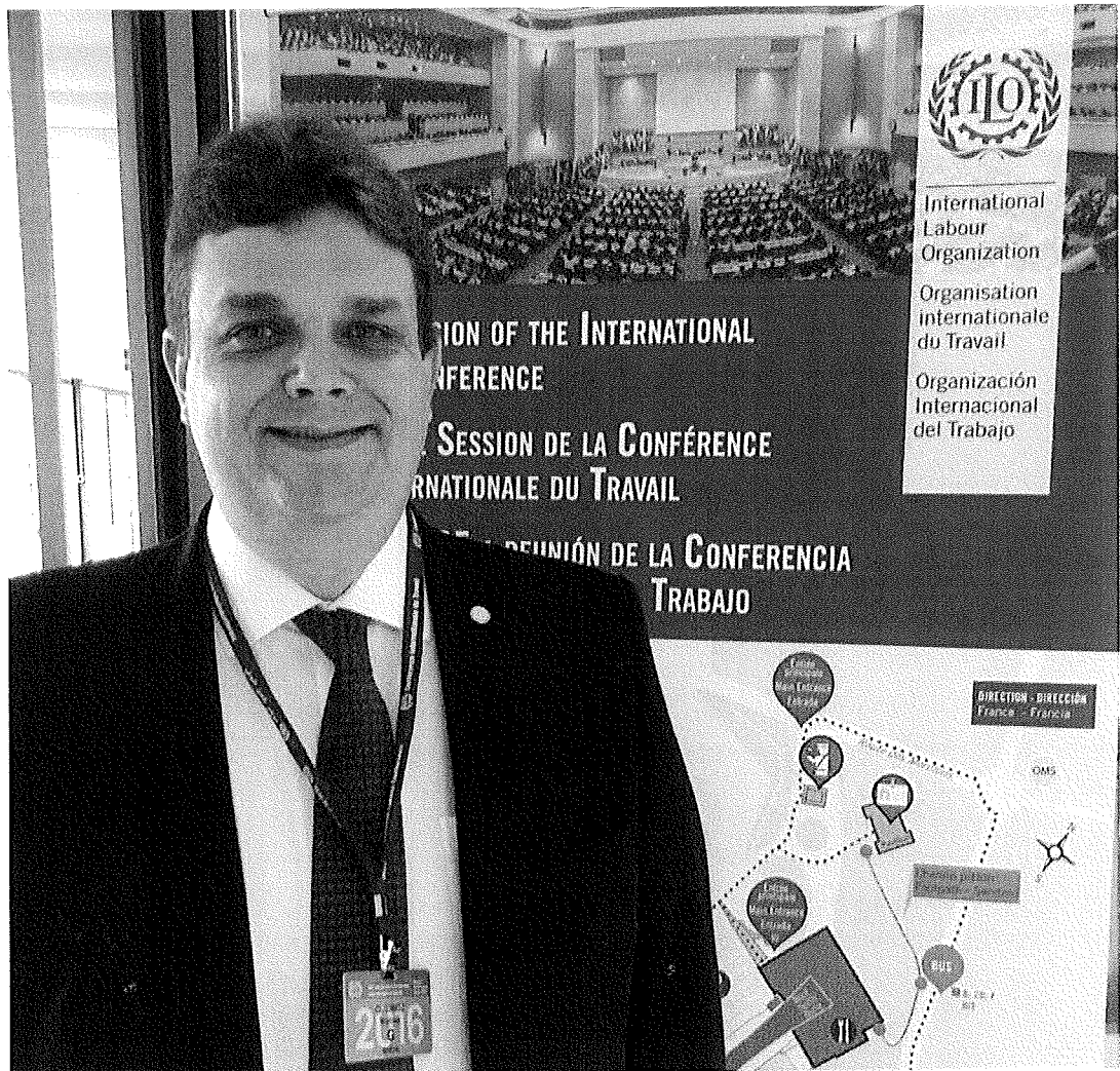
Entrada do salão da Reunião da Conferência Internacional do Trabalho;