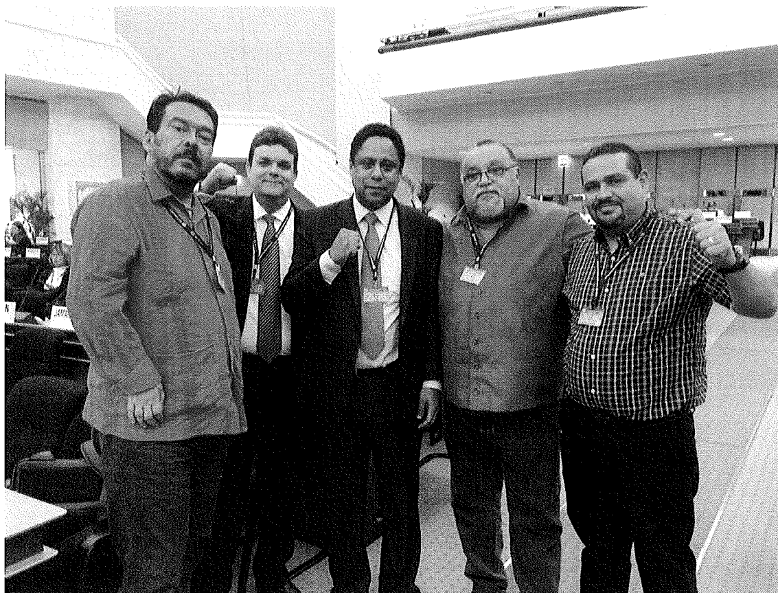
Encontro com a delegação Venezuelana que denunciou no plenário impeachment da Presidente Dilma;

Outro encontro que merece destaque, foi a manifestação da delegação venezuelana, que usou a palavra no plenário para denunciar o golpe perpetrado no Brasil, afastando a presidente Dilma Rouseff, legitimamente eleita pela povo brasileiro.