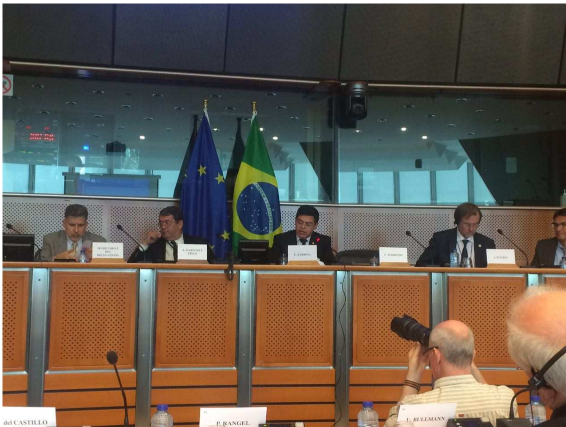
Figura 7: Deputado Eduardo Barbosa preside audiência pública