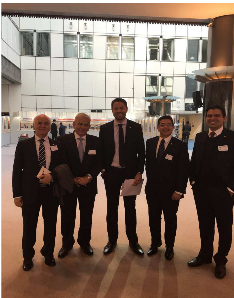
Figura 6: Deputados Brasileiros no Parlamento Europeu

Ao final da audiência pública, os parlamentares brasileiros fizeram uma visita guiada pelo Parlamento Europeu.