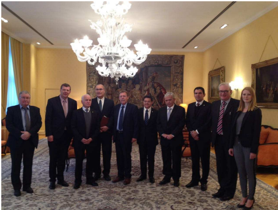
Figura 5: Parlamento Belga

Na programação da mesma data, aconteceu uma reunião com membros do Partido Popular Europeu (Democratas-Cristãos) (PPE) que demonstraram grande interesse em socializar discussões políticas e acompanhar o processo político brasileiro; e outra reunião com membros da Aliança Progressista dos Socialistas e Democratas no Parlamento Europeu (S&D), também interessados sobre o processo político brasileiro.