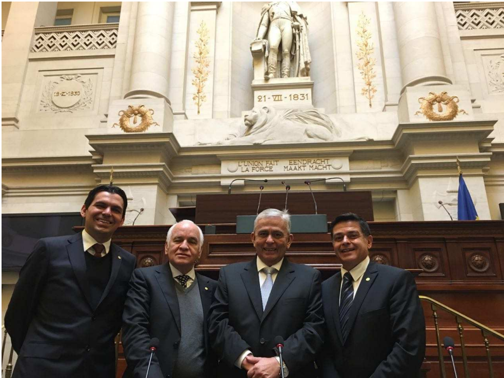
Figura 3: Parlamento Belga