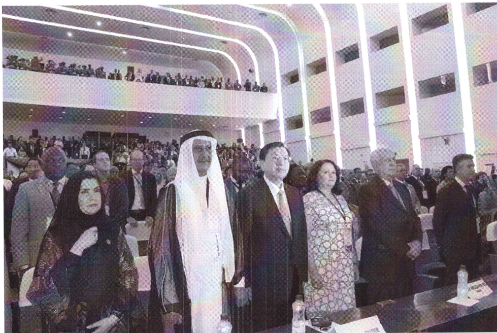
Figura 3 - Deputado Jarbas Vasconcelos