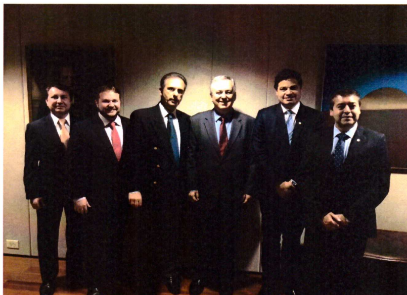
Registro, na Embaixada Brasileira em Washington, com a delegação brasileira o Embaixador Figueiredo.

Após a visita a House of Representatives , a delegação brasileira foi recebida pelo Embaixador Figueiredo na Embaixada do Brasil em Washington. Na reunião foram discutidas questões como a atual situação político-econômica do Brasil e as relações diplomáticas entre nosso País e os Estados Unidos.