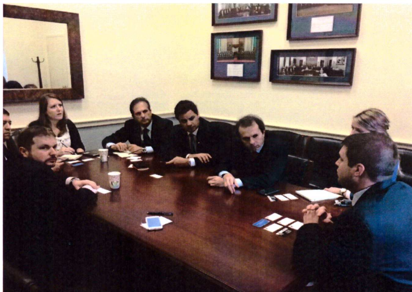
Registro durante a reunião na House of Representatives.

Após a visita a House of Representatives , a delegação brasileira foi recebida pelo Embaixador Figueiredo na Embaixada do Brasil em Washington. Na reunião foram discutidas questões como a atual situação político-econômica do Brasil e as relações diplomáticas entre nosso País e os Estados Unidos.