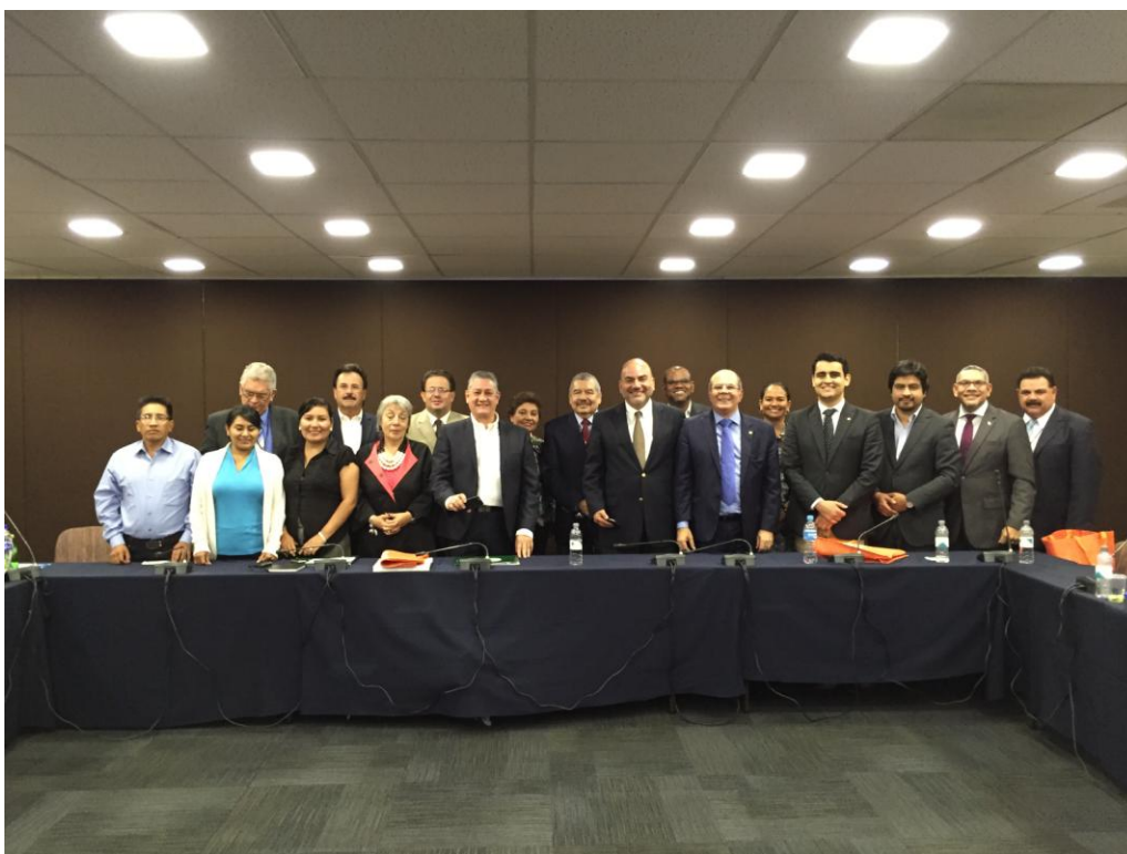
Reunião da Comissão