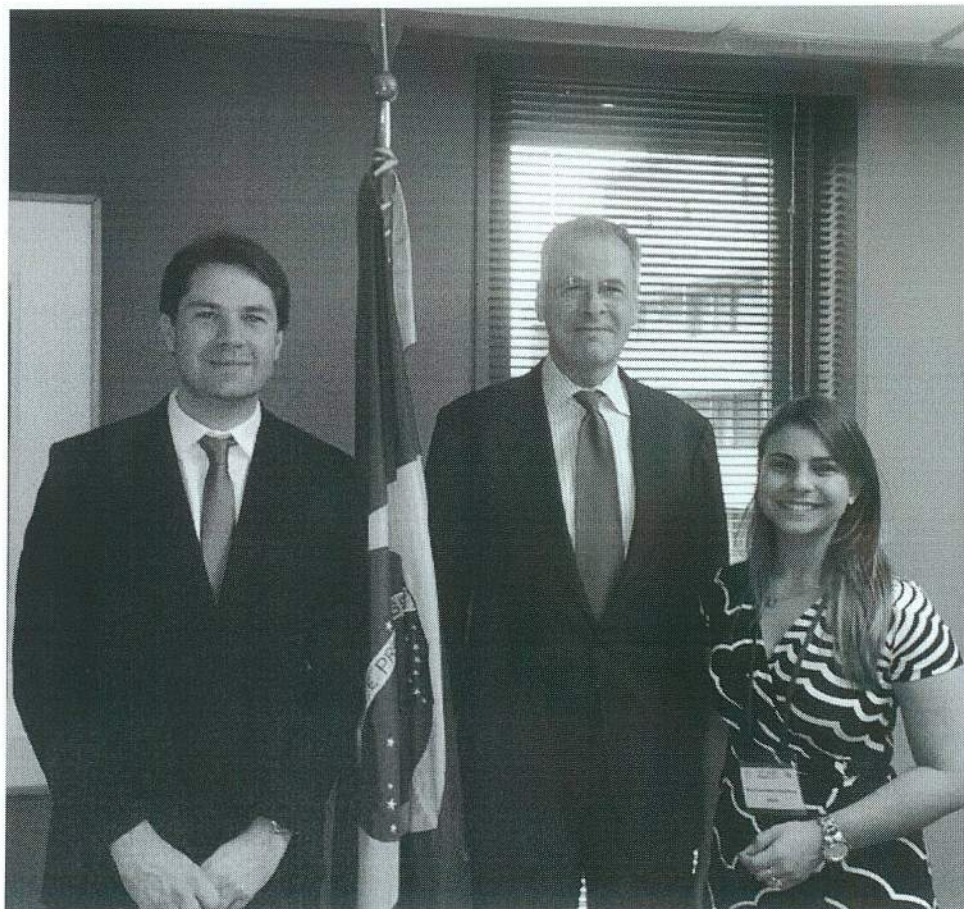
Figura 3 – Audiência com o Embaixador do Brasil no Japão André Corrêa Camargo do Lago.