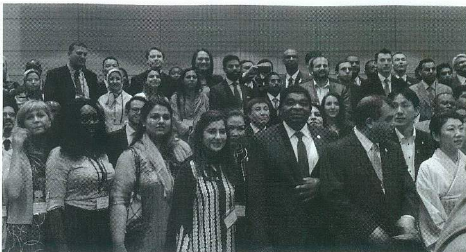
Figura 2 - Foto do Grupo de Jovens Parlamentares com o Presidente da UIP, Sr. Saber Chowdhury