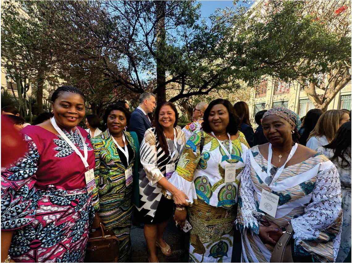
Delegação do Congo