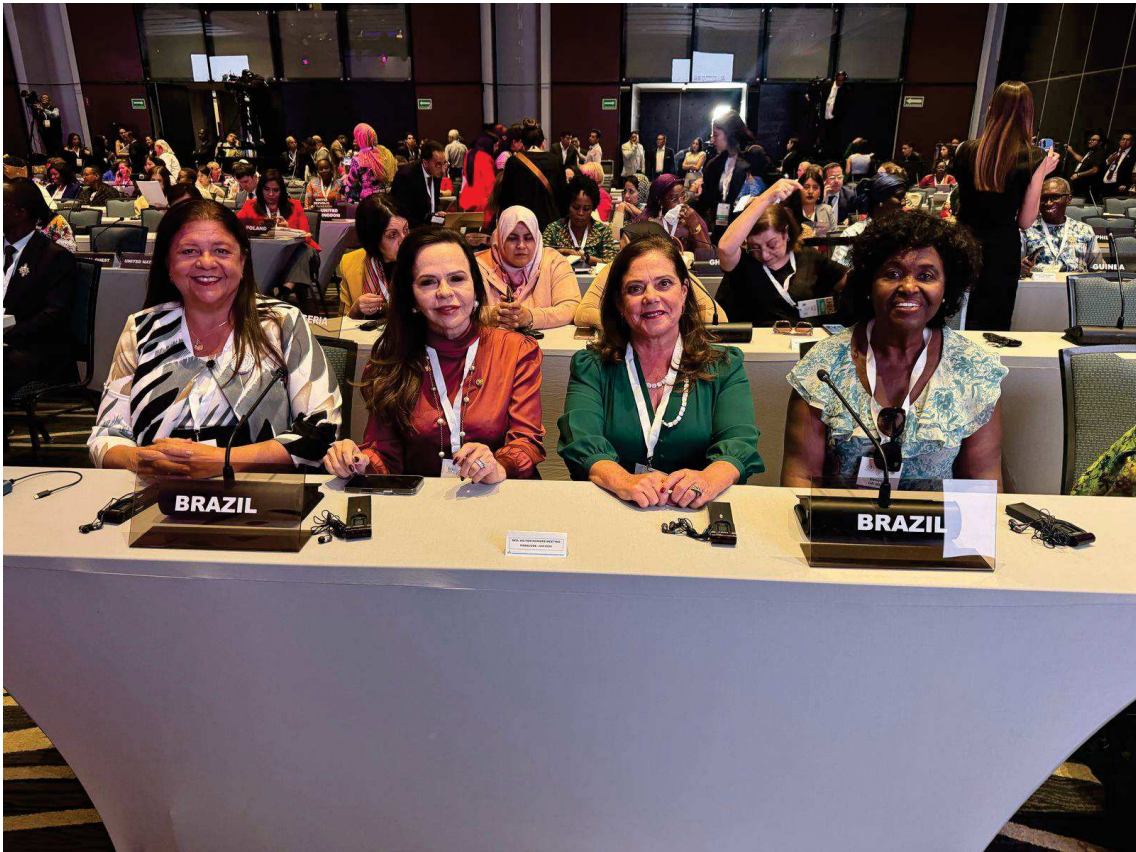
1º dia de reuniões, com pronunciamento da Deputada Benedita da Silva, ao final