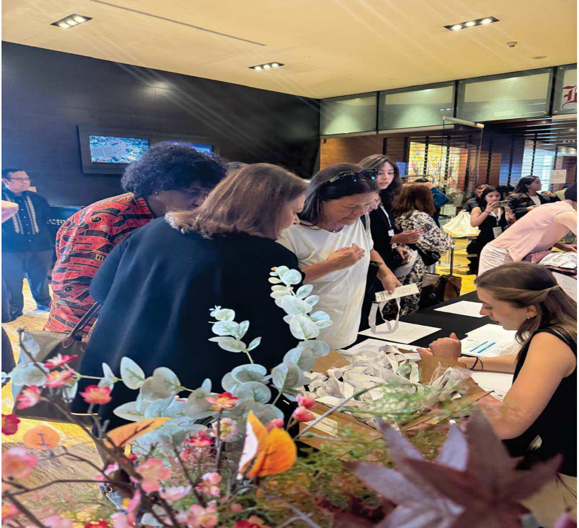
Inscrição dia 13 de março, 10h