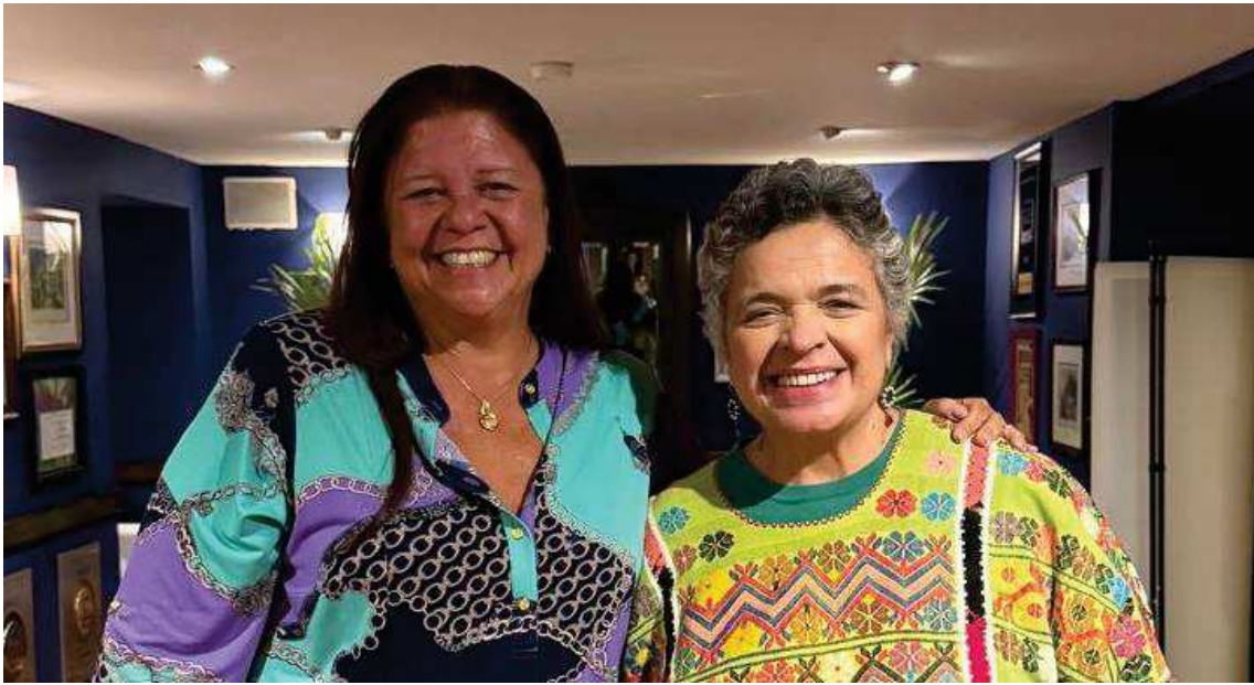
Com a Sra Beatriz Paredes, ex Senadora e ex Embaixadora do México no Brasil