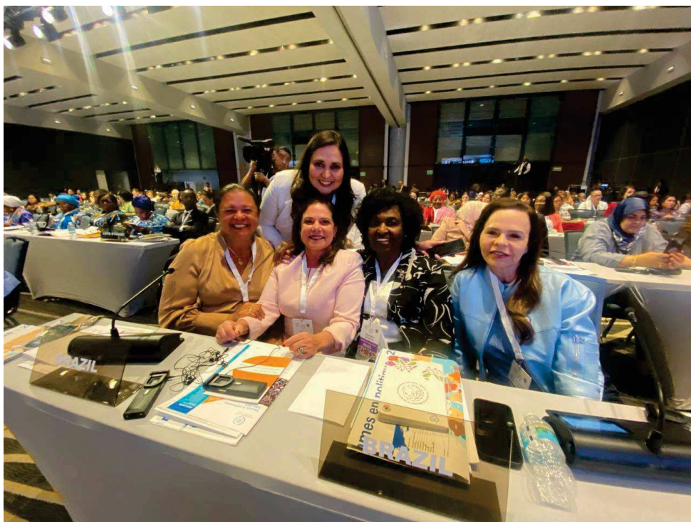
Figure 2 - Deputada Laura Carneiro, Senadora Cynthia Lopez Castro, Deputada Soraya Santos, Deputada Benedita da Silva, Senadora Professora Dorinha Seabra