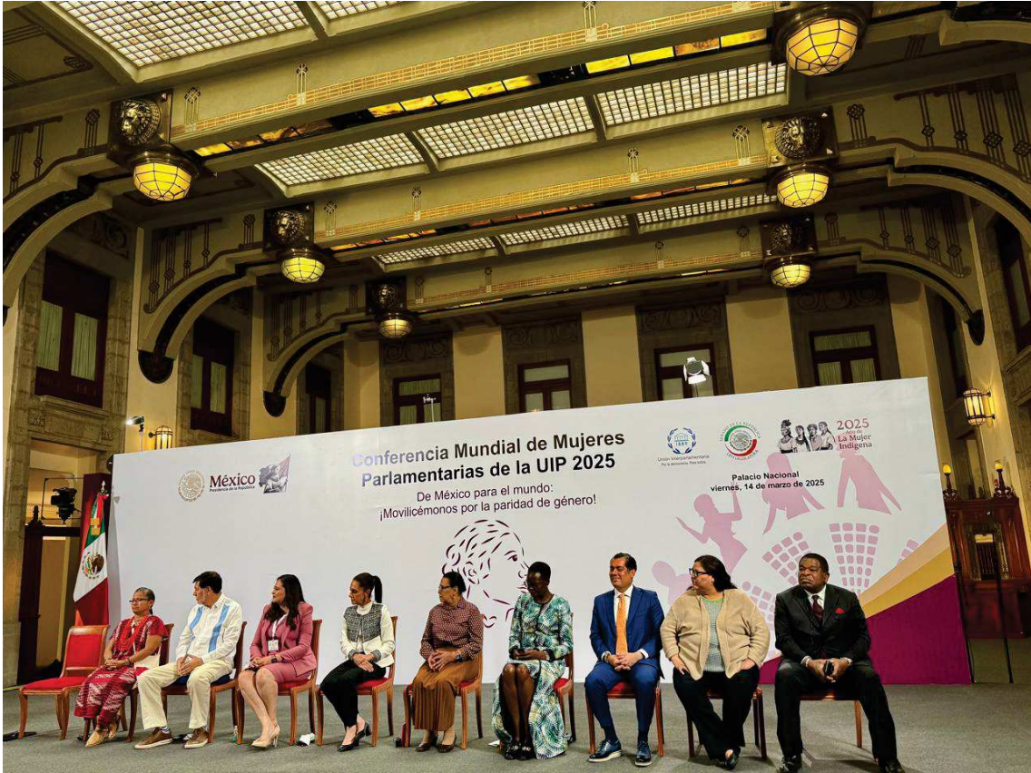
Abertura Oficial no Palácio do Governo