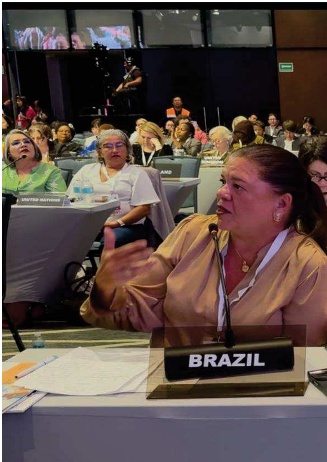
2º Dia de reuniões- Pronunciamento s/legislação penal e eleitoral brasileira ( em nome da Delegação Brasileira )