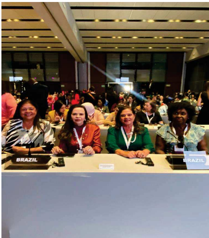
Figure 1 - Deputada Laura Carneiro, Senadora Professora Dorinha Seabra, Deputada Soraya Santos, Deputada Benedita da Silva