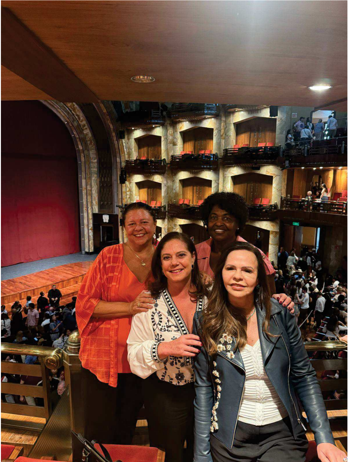
Show Folclórico oferecido as delegações no domingo ( 16/03/25), no Palácio de Belas Artes