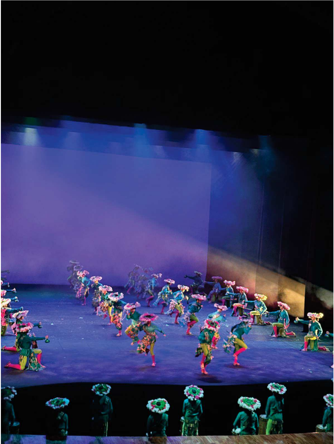
Show Folclórico oferecido as delegações no domingo ( 16/03/25), no Palácio de Belas Artes