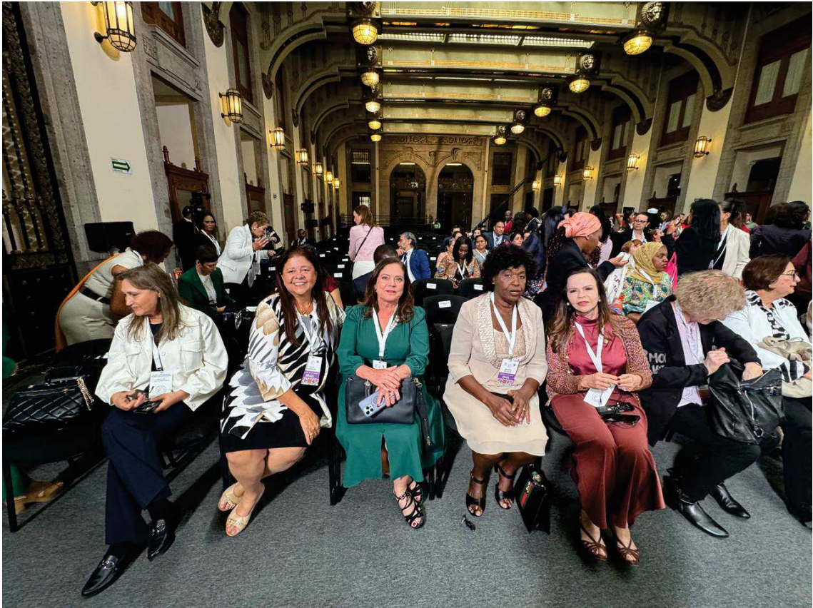
Abertura Oficial no Palácio do Governo