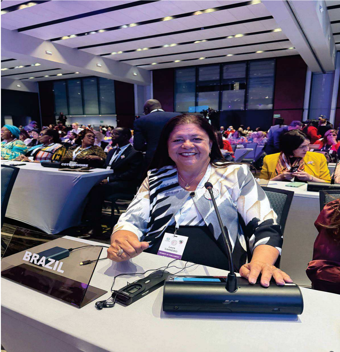
1º dia de reuniões , após a Abertura Oficial