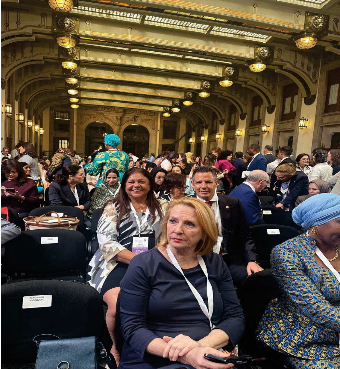
Abertura Oficial no Palácio do Governo