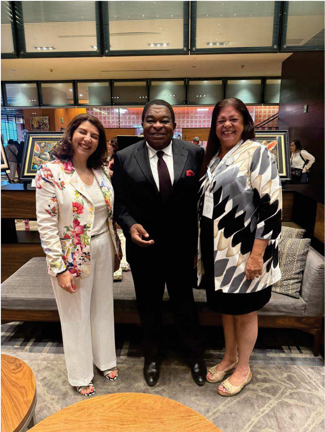
Secretário Geral da UIP, Sr. Martin Chungong