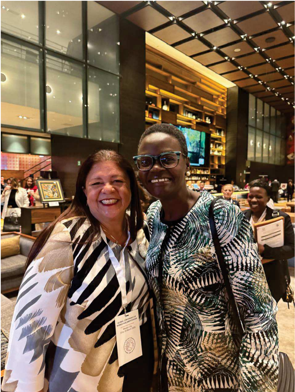
Presidente da UIP e Presidente da Assembleia Nac da República Unida da Tanzânia, Túlia Ackson