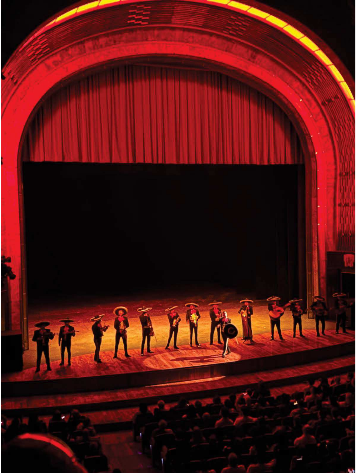
Show Folclórico oferecido as delegações no domingo ( 16/03/25), no Palácio de Belas Artes