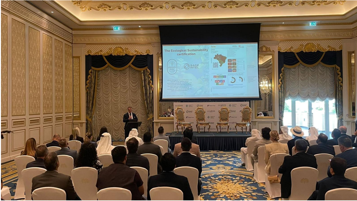
(registro da participação do deputado federal Aliel Machado no Energy Transition Forum)