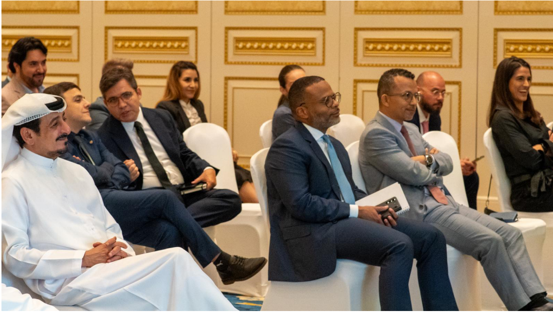
(registro da participação do deputado federal Aliel Machado no Energy Transition Forum)