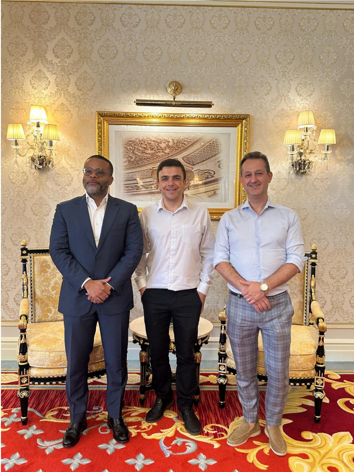
(registro da reunião com o representante do Banco Nacional de Investimentos de Angola)