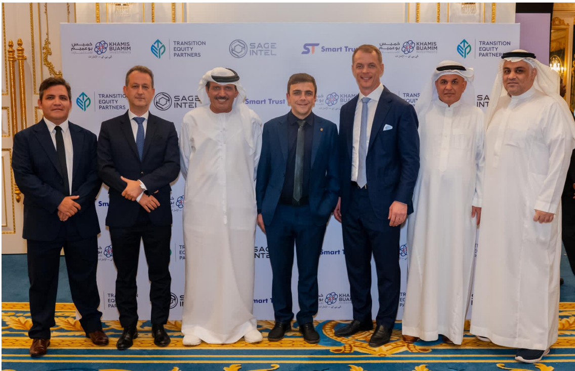
(registro da participação do deputado federal Aliel Machado no Energy Transition Forum)